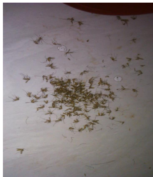
Gambar 4 Hasil Uji Coba Kedua (hari ke-3)

Berdasarkan penelitian sebelumnya yang menyatakan bahwa frekuensi 35KHz-45KHz memiliki pengaruh dalam mengganggu nyamuk, UV lamp yang dipasang juga mampu mendatangkan nyamuk dibuktikan dengan adanya nyamuk yang masuk dalam perangkap.