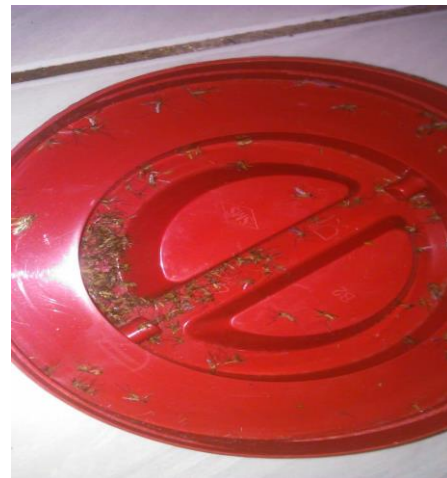
Gambar 3 Hasil Uji Coba Pertama (hari ke-2)

Adapun hasil nyamuk yang mati karena melewati kipas yang datang karena efek UV lamp ditunjukkan seperti pada gambar di bawah ini.