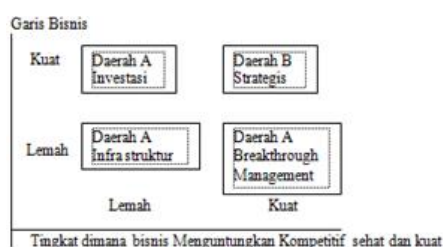
Gambar 2 Gambaran dengan tingkatan dukungan komputer

Ada beberapa cara untuk menentukan nilai Korporat. Salah satu cara yang digunakan adalah dengan melihat tingkat hubungan antara kondisi line of business dengan tingkat dukungan komputer terhadap bisnis tersebut.