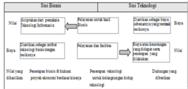
Gambar 1 Hubungan Sisi Bisnis dengan Sisi Teknologi [marilyn 85]

Informasi Ekonomi dikembangkan dan dikenalkan oleh Marilyn m. Parker untuk membantu para pengambil keputusan dalam melakukan evaluasi terhadap suatu pemakaian Teknologi Informasi. Pemakaian Teknologi Informasi begitu kompleksnya sehingga di butuhkan suatu alat pengukuran yang sesuai untuk dapat menentukan kelayakan pemakaian Teknologi Informasi. menurut informasi ekonomi kelayakan suatu penerapan dan pemakaian Teknologi Informasi dapat di lihat dari dua Sisi yaitu Sisi Bisnis dan sisi Teknologi. Sisi bisnis adalah atribut teknologi dan bisnis yang ditagih untuk sumber daya yang digunakan untuk menghasilkan nilai termasuk resikonya, sedang dari sisi Teknologinya adalah biaya sebenarnya yang dikeluarkan untuk pemakaian sumber daya dalam memberikan pelayanan kepada sisi bisnis.