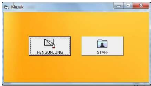
Gambar 2. Tampilan Form Masuk.