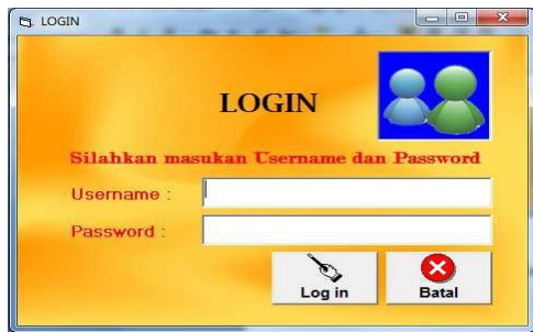
Gambar 3. Tampilan Menu Login