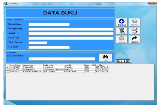
Gambar 5. Tampilan Form Data Buku